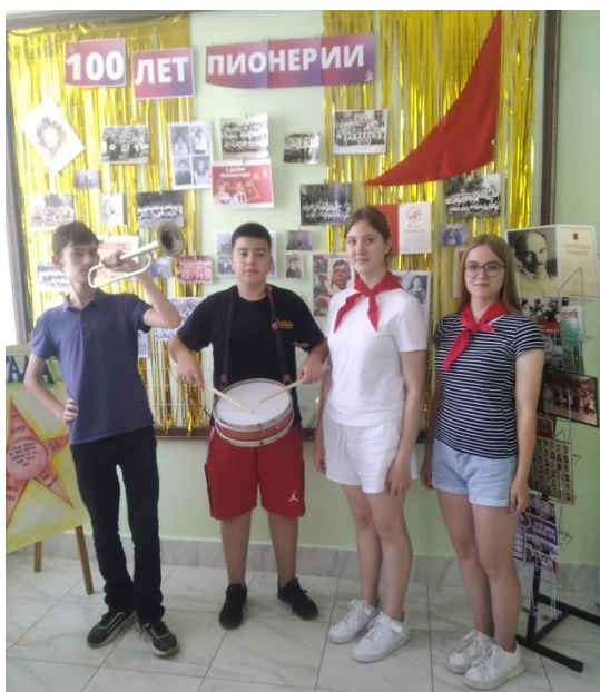
Фото 1. « К проведению пионерского слёта готовы!»