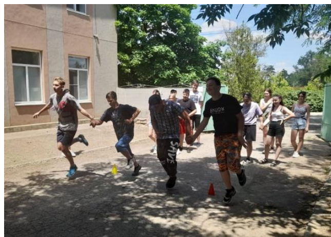
Фото 6. «Весёлые старты»