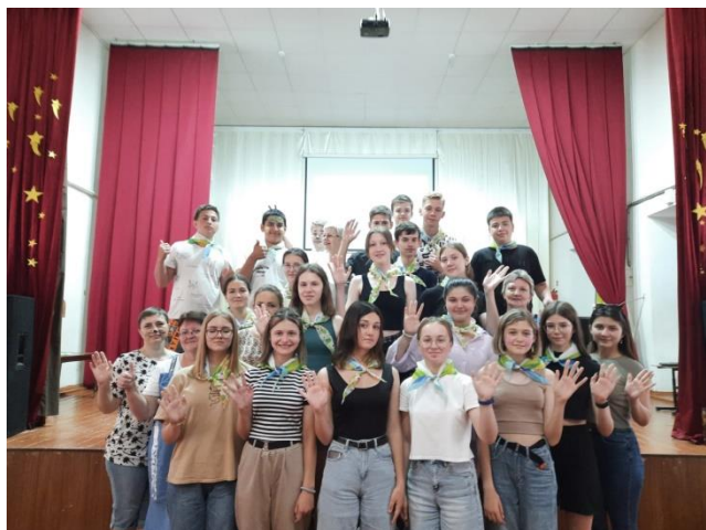
Фото 5. Акция «Мы будущее России»