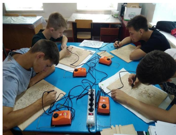
Фото 8. Работа трудовой мастерской по выжиганию картин.