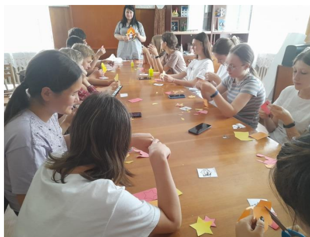
Фото 4. Работа пионерских мастерских. Изготовление пионерского значка.