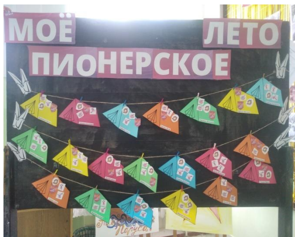
Фото 3. Доска достижений.