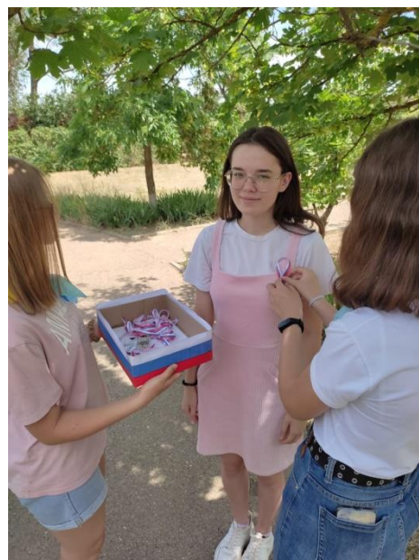
Фото 2. Акция ко Дню России