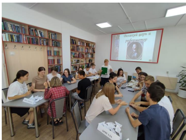
Фото 7. Квест-игра «Пётр 1-великий царь и реформатор»